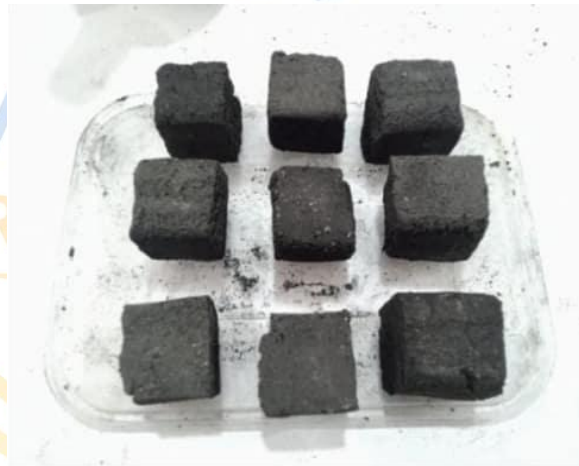
Gambar 2. Hasil Cetakan Briket

Setelah proses pencetakan dilakukan, diperoleh hasil briket dengan bentuk persegi dan tingkat kepadatan yang cukup baik. Dokumentasi hasil cetakan briket dapat dilihat pada Gambar 2.