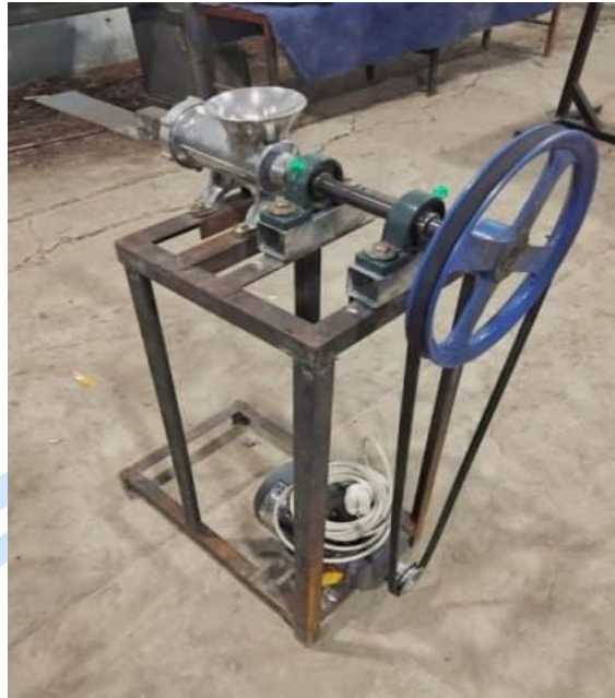
Gambar 1. Mesin Pencetak Briket Semi-Otomatis

Berdasarkan Gambar 1, mesin berhasil dibuat sesuai desain perancangan dan dapat digunakan untuk proses pencetakan briket pada skala rumah tangga.